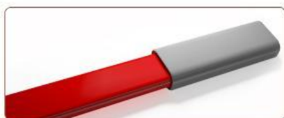
2 Греющий кабель GRX2 CR