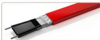
3 Комплект для подключения питания