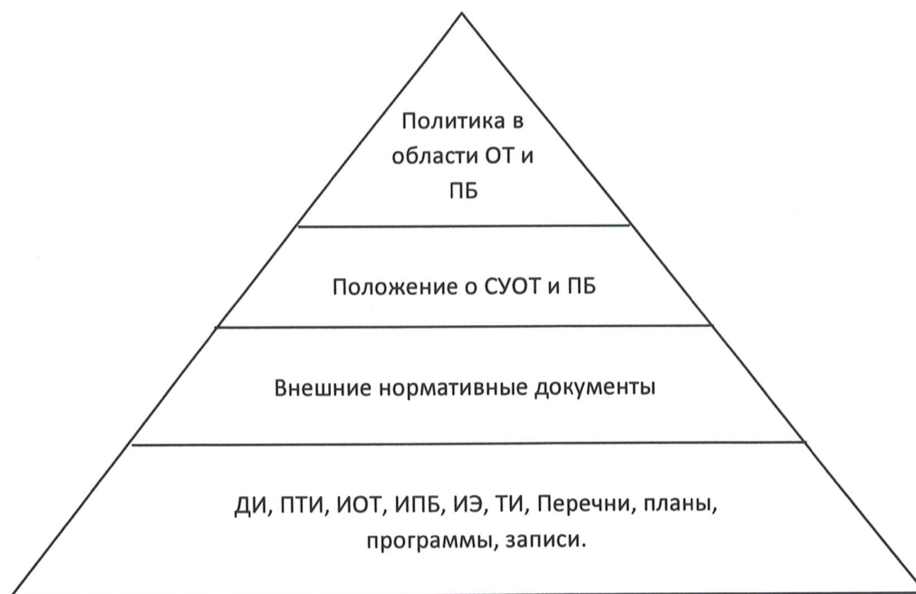
Рисунок 1. Документация СРОГ и ПБ.

5.7. Ознакомление работника с обязательными для его рабочего места документами (положениями, инструкциями и др.) осуществляют под роспись.